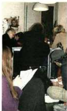
Lange Nacht der aufgeschobenen Texte: Der Andrang war groß

In Wien ist das Schreibzentrum das erste seiner Art an einer Hochschule, in Österreich das zweite. Die Alpen-Adria-Universität Klagenfurt hat ihr Schreibzentrum bereits 2004 ins Leben gerufen. Die Idee der Schreibzentren kommt ursprünglich aus dem anglo-amerikanischen Hochschulraum, wo sie zum Standard gehören.