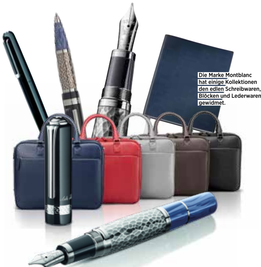
Die Marke Montblanc hat einige Kollektionen den edlen Schreibwaren, Blöcken und Lederwaren gewidmet.